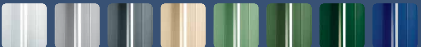
RAL 9010 Blanc RAL 9006 Blanc Gris RAL 7015 Gris Ardoise RAL 1015 Blanc Ivoire RAL 6021 Vert Gris RAL 6011 Vert réséda RAL 6005 Vert mousse RAL 5010 Bleu gentiane

N.B.: toutes les couleurs reportées ci-dessus ne correspondent pas exactement au nuancier RAL.